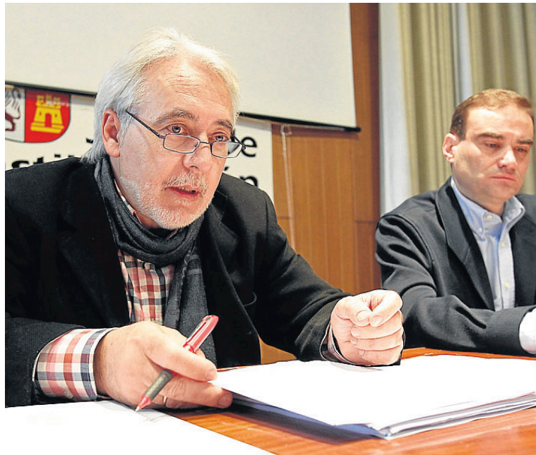
Los responsables sindicales, ayer en Soria. LUIS ÁNGEL TEJEDOR

El también responsable de la Federación nacional del sindicato censuró «los recortes regional del 6,3% y nacional del 8%» de las